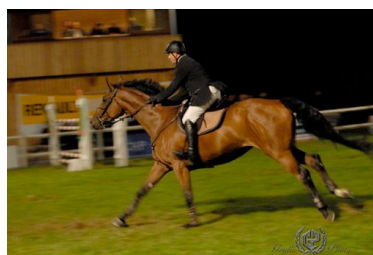
Pascal Lothe/Ulbra (droits GrafficPhoto)

Tous les résultats sur www.pompadour-equestre.com