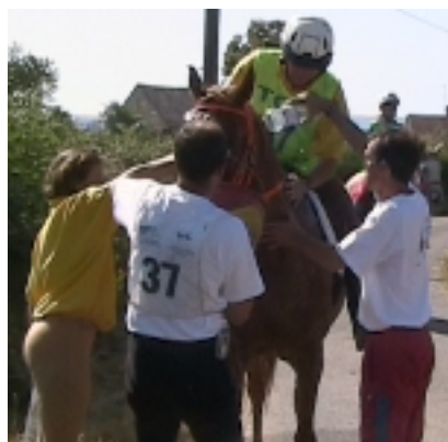
"Sheik Al Babul" et ses e.s.c.l.a.v.e.s.*